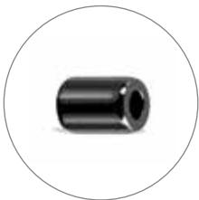
PIÈCES FONCTIONNELLES EN CÉRAMIQUE TECHNIQUE

Ceramaret produit des chevilles de plateau en très grandes quantités mais peut aussi satisfaire aux exigences des manufactures horlogères pour des moyennes et petites séries.