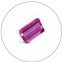
CHEVILLES DE PLATEAU

Elles sont façonnées selon les dessins clients dans du rubis de grande pureté, avec des exigences de précision dimensionnelle de l'ordre du micron. La précision d'usinage de l'angle d'impulsion ainsi qu'un état de surface exceptionnel sur les surfaces de contact confèrent à l'organe réglant d'un mouvement mécanique horloger la précision de marche et la longévité attendue par les industries de la haute horlogerie.